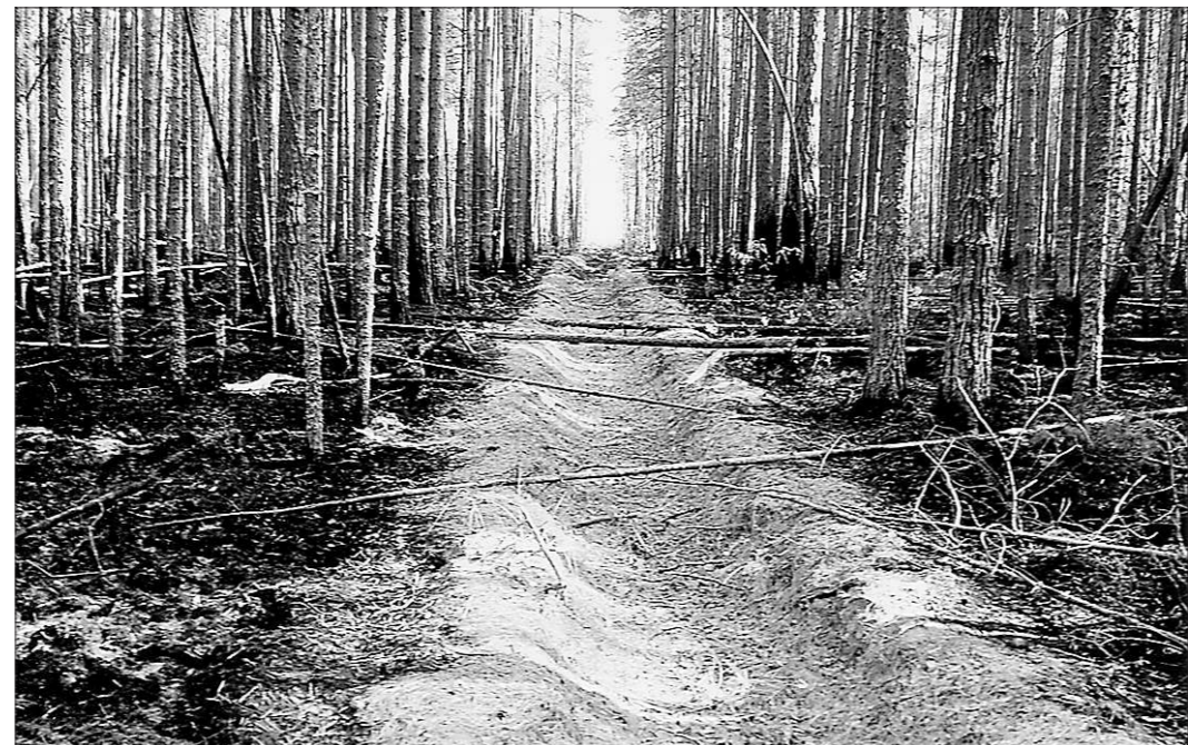
Даже к сгоревшему лесу предприниматели проявляют интерес.

На продаже повреждённого леса департамент намерен получить десятки миллионов рублей, которые пополнят областную и федеральную казну.