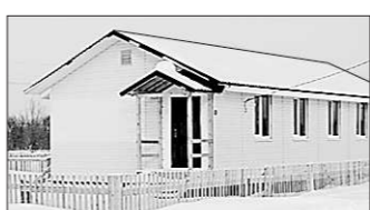
В таких домах живут погорельцы из Сарьянки.

принимательства в деревнях. Сегодня Таборинское муниципальное образование является дотационной территорией и самостоятельно зарабатывает только семь процентов от своих расходов. Развитие фермерства могло бы решить эту проблему, — пояснил председатель правительства области.