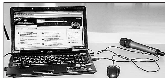
Придется подучиться...

Обозначились и проблемы. Из числа анекдотичных: на приём к каменским врачам записываются... тагильчане. Как в «Ирони судьбы»: одинаковые улицы, номера поликли-