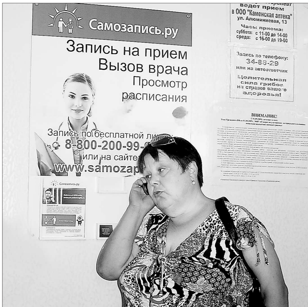
Раньше было удобнее записаться на приём к врачу по телефону, а теперь — по Интернету.