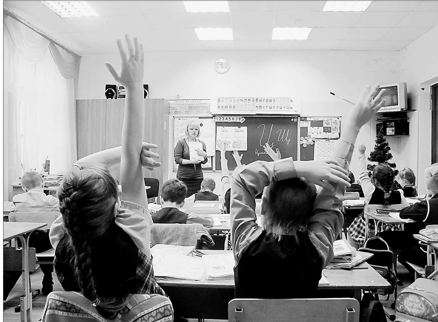
На уроках теперь оценивают не только знания, но и активность детей.