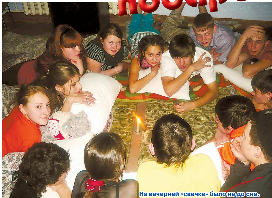
На вечерней «свечке» было не до сна.

Перед сном прошла традиционная «свечка», от усталости некоторые ребята клевали носом, но не могли уснуть, так как было интересно выслушать друг друга, подвести итоги прожитого дня. Были на наших сборах и тренинги на доверие, и мастер-классы «Познай себя», и даже «Верёвоч-