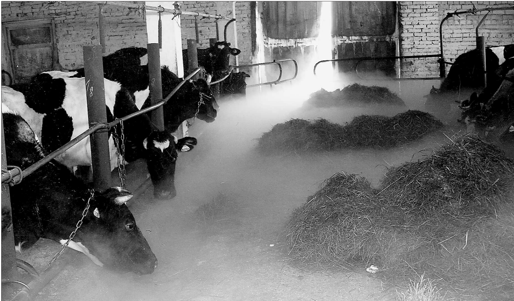
На фермах зимой главное - корма.

Более подробную информацию можно получить на сайтах: http://econom.midural.ru, http://sverdlinvest.midural.ru.