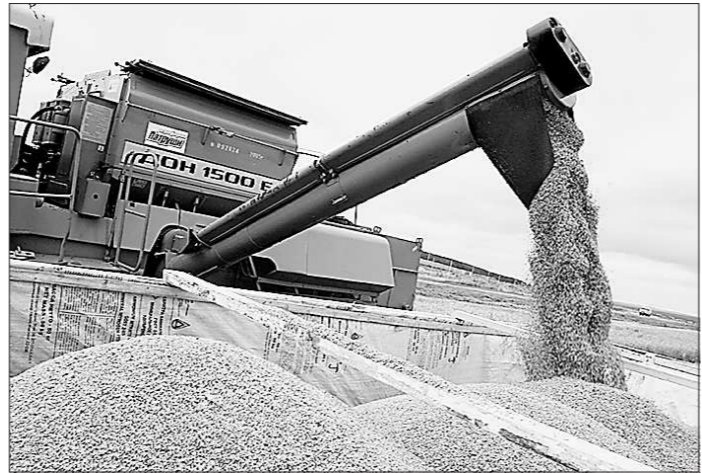
Золотое богатство российских полей.

Начиная с июля 2010 года цена на пшеницу в России непрерывно повышается. Ситуация сложная. Однако мы надеемся, что благодаря таким шагам как предстоящая реализация зерна из интервенционного фонда, государство сумеет остановить подорожание пшеницы. Агентство по развитию рынка продовольствия действительно готовится закупать зерно на предстоящих торгах. Однако надо помнить, что биржа живёт по законам рынка. В ходе торгов там может установиться любая цена. Если она окажется слишком высокой, то мы откажемся от запланированной покупки.