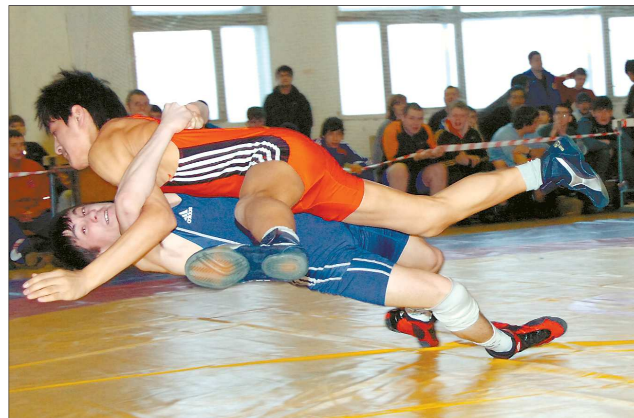
На ковре – соперники, а в жизни – друзья.

Впереди у юных борцов чемпионат Уральского фе-