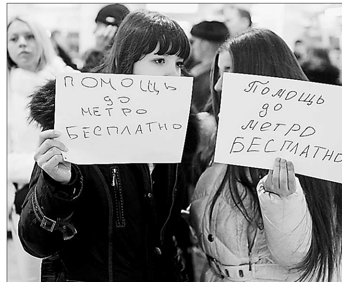
Москва. Москвичи, приехавшие в аэропорт Домодедово, предлагают бесплатно довезти до метро.

менно по аэропорту не водят экскурсии. Сейчас регистрация пассажиров на рейсы осуществляется в штатном режиме. Рейсы, в том числе и в аэропорт Домодедово, вылетают по расписанию.