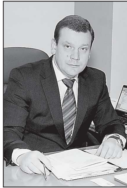
Ведению этого совещания стала непростая ситуация на продовольственном рынке. По данным территориального органа Федеральной службы госста-

Как сообщили в департаменте информационной политики губернатора Свердловской области, поводом к про-