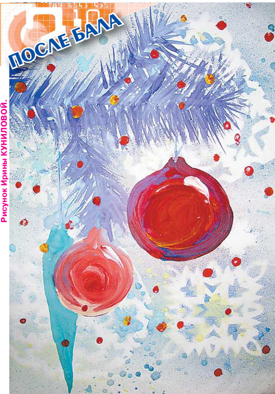
Рисунок Ирины КУНИЛОВОЙ.

*** Новый год волшебный – Всех чудес отгадка! И всегда под ёлкой Есть подарок сладкий. И видать в окошко Фейерверк сквозь льдинки, В разноцветных красках Падают искринки. Звёздочки-снежинки На ветру кружатся, Возле снежных горок Дети суетятся. Мы устроим дома Дружный хоровод, И под смех и гомон Встретим Новый год.