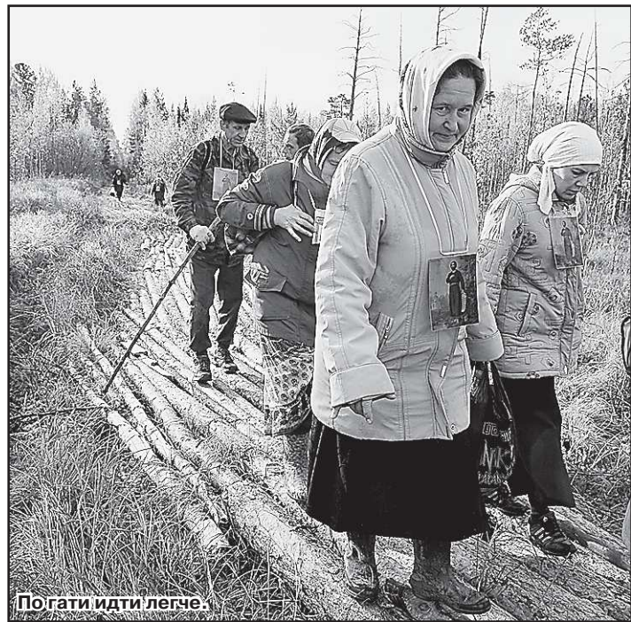
По гати идти легче.

Эта «малая» Симеонова тропа является частью большого маршрута, как малая родина каждого из нас – островок в океане большой общей Родины. В южной своей части тропы, по которой ходил святой, лежала чуть в стороне от нынешней дороги. В начале XVII века ни мостов, ни паромов через реку Тагил не было. Очевидно, святой Симеон переправлялся вброд или на лодке. Современный сухопутный обход появился лишь в прошлом веке. Во время крестного хода в 1914 году в Махнёво был паром, который перевозил путников через реку. Он переправил часть паломников, шедших из Екатеринбургa, а остальные перешли Тагил по мосту, расположенному выше по течению. Подлинная паломническая дорога находится в северной части Махнёво, за околицей улицы Таёжной. Здесь проходит древний Меркушинский, он же Добровольский, тракт. Тут, около Сухой речки, ныне обустроена стоянка для транспорта путешественников. Сюда теперь можно доехать на машине. От Сухой речки начинается пешеходная дорога, по которой веками ходили паломники, повторяя путь святого угодника.