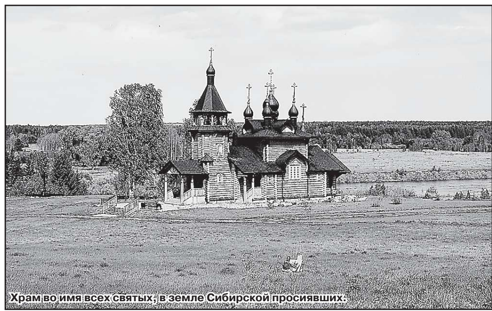
Храмово имя всех святых, в земле Сибирской просиявших.

Римма ПЕЧУРКИНА.