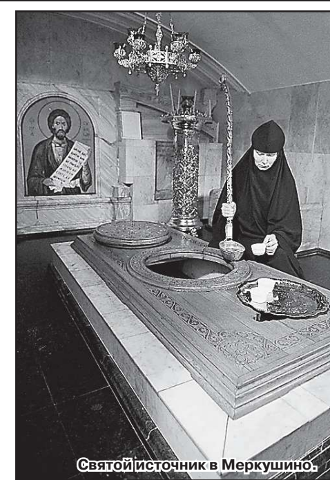
Святой источник в Меркушино.

Далее встретится белоснежная крепость Свято-Косминской пустыни, названная так по имени святого блаженного Космы Верхотурского. Недужный ногами, он полз на коленях за гробом святого