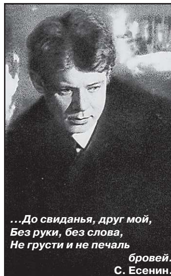
...До свиданья, друг мой, без руки, без слова, Не грусти и не печаль бровей. С. Есенин.