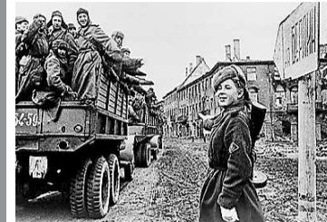
Штыки от стужи побелели, Снега мерзали синевой. Мы, в первый раз надев шинели, Сурово бились под Москвой.

Наступление на московском направлении нацисты готовили как «генеральное», решающее. Для сокру-