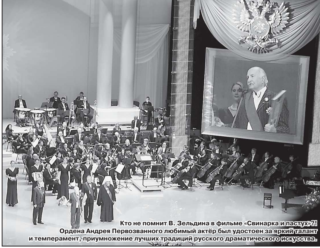
Кто не помнит В. Зельдина в фильме «Свинарка и пастух»?! Орден Андрея Первозванного любимым актёр был удостоен за яркий талант и темперамент, умножение лучших традиций русского драматического искусства.

Первозванного. По традиции последних лет честь участвовать в церемонии предоставляется и победителям журналистского конкурса «Я люблю Россию».