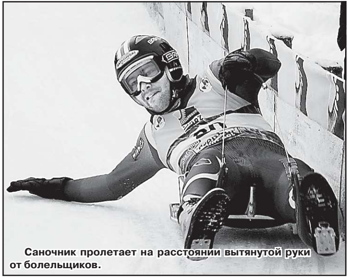
Саночник пролетает на расстоянии вытянутой руки от болельщиков.