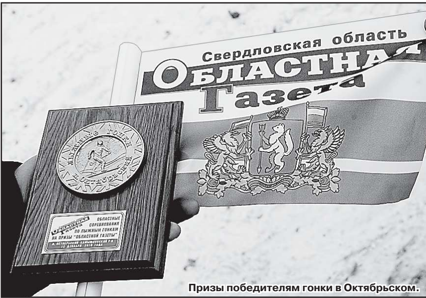
Призы победителям гонки в Октябрьском.

На старт наших соревнований в этом году вышли 1439 участников. Это новый рекорд массовости