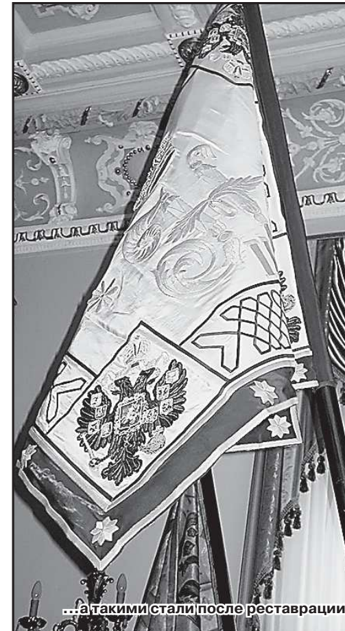
...в такими стали после реставрации

Ирина КЛЕПИКОВА. Екатеринбург – Краснодар – Синий – Екатеринбург. (Продолжение следует).