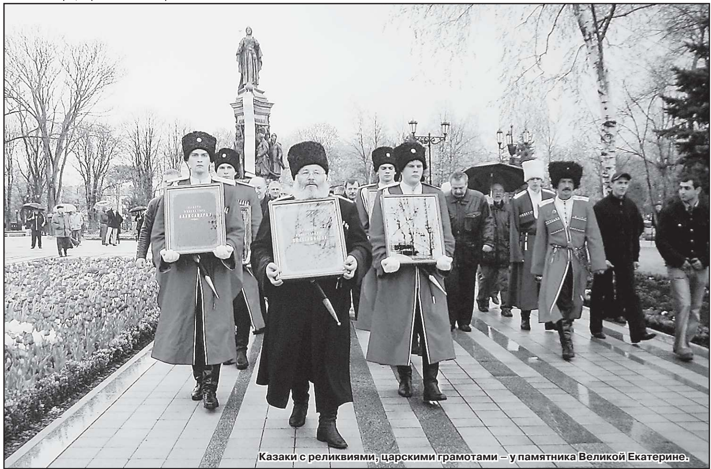
Казаки с реликвиями, царскими грамотами – у памятника Великой Екатерине.

А ещё здесь – атаманские булавы, подлинный мундир императора Александра II,