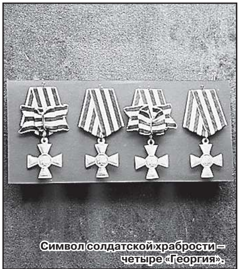
Символ солдатской храбрости – четыре «Георгия».

Работа великого Фаберже – папка для приветственного адреса (размером с до-