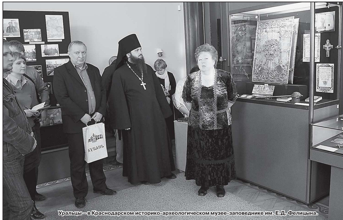
Уральцы – в Краснодарском историко-археологическом музее-заповеднике им. Е.Д. Фелицына.

В зале казачьих регалий и реликвий на небольшом простенке – десятка два фотографий. Экскурсанты обычно ненадолго останавливаются здесь либо не останавливаются вовсе. Что – фотографии?! Булавы, сабли, императорская черкеска – это гораздо любопытнее. А журналистам, участникам пресс-тура «Екатерининские города», и вовсе дали ещё возможность сфотографироваться на фоне боевых казачьих знамен. И даже прикоснуться (!) к ним... Но два десятка снимков, формально не являющихся раритетами, сделанных в наше время, по-своему бесценны. Зафиксированная на фото драматическая история спасения коллекции – свидетельство, которое дорогого стоит. Из фото, лаконичных подписей к ним, комментарии экскурсовода возникает постепенно