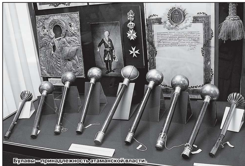
Булавы – принадлежность атаманской власти.

одиссея боевых казачьих реликвий и регалий.