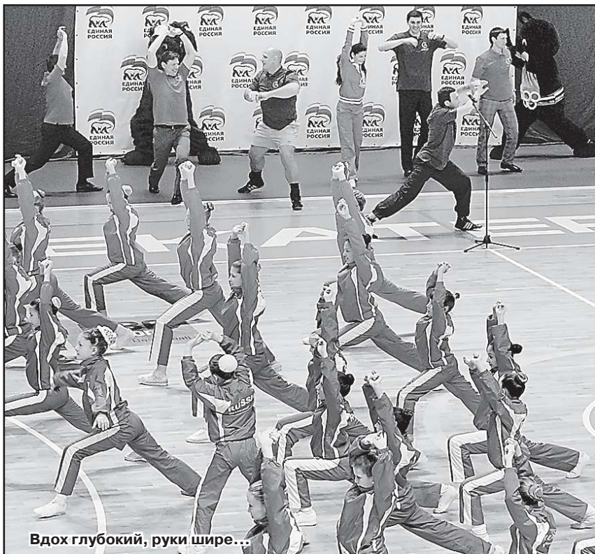
Вдох глубокий, руки шире...

Открыл «олимпийскую зарядку» губернатор Свердловской области Александр Мишарин.