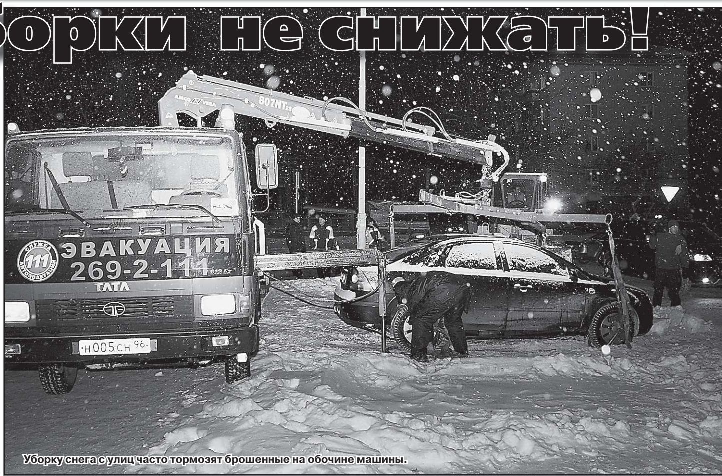
Уборку снега с улиц часто тормозят брошенные на обочине машины.