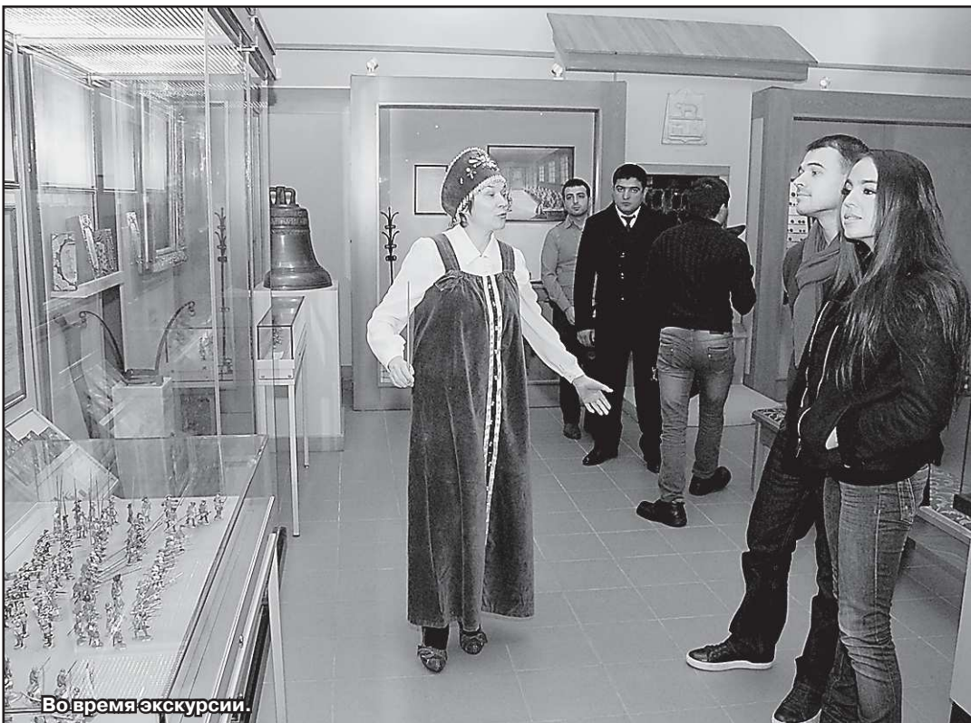
Во время экскурсии.