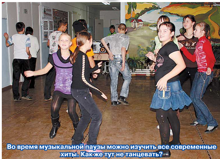
Во время музыкальной паузы можно изучить все современные хиты. Как же тут не танцевать?

К организации внеучебного процесса «Школы полного дня» педагоги и ребята подошли с душой. На первом же занятии кружка «Юный натуралист» в классе появился ещё один ученик – вол-