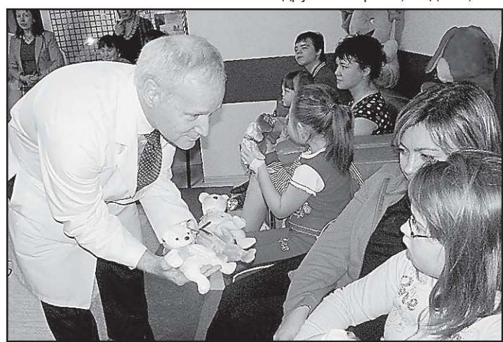
твоя методика работает в руках у американцев. У каждого продуктивно работающего хирурга свои знания, свои патенты, профессиональному взгляду достаточно увидеть какой-то новый нюанс и можно двигаться дальше. В этот раз проводили сложные реконструктивные операции, длившиеся в среднем по 6-7 часов. Исправляли деформации прикуса, оперировали пациентов с расщелинами, с недоразвитием челюстей, деформациями костей лица из-за воспалительных заболеваний. Была и шестилетняя пациентка, которой в годик удаляли саркому, пришлось тогда задеть и большую часть тканей лица, верхнюю челюсть. Рецидивов не было, и сейчас девочка проведена реконструктивная операция — восстанавливали внешний вид...