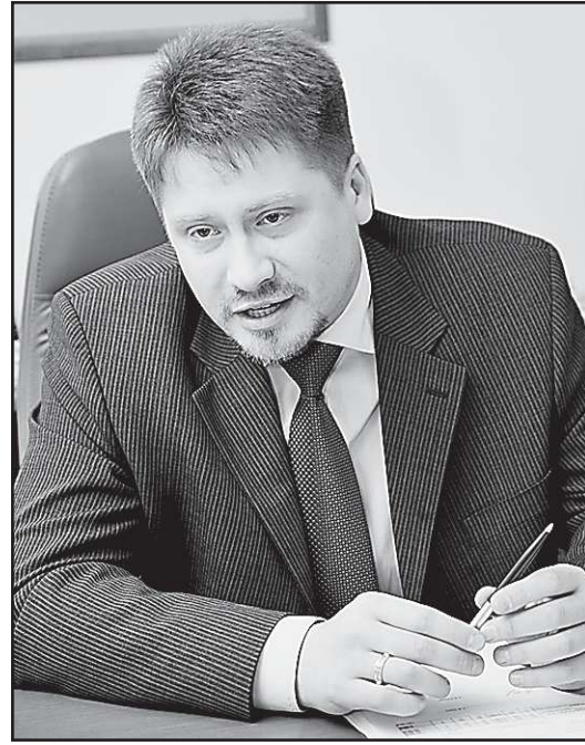
Беседовала Наталья ПОДКОРЫТОВА.

—Всё неизвестное беспокоит, это естественно. В основном, страсти на муниципальном уровне, где коллективы не подготовлены к переменам. Даже на уровне руководителей муниципалитетов порой нет понимания. В таком