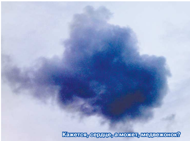
Кажется, сердце, а может, медвежонок?

У нас с друзьями есть увлечение-игра: лежать на спине и рассматривать облака. На что же облачко больше похоже – на медвежонка с высунутым язычком или всё-таки на раскидистое дерево?