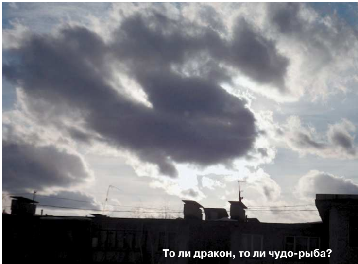
То ли дракон, то ли чудо-рыба?