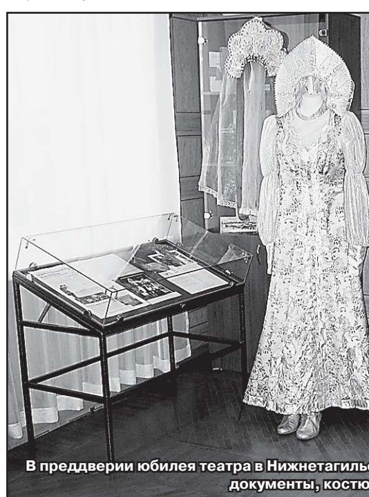
В преддверии юбилея театра в Нижнетагильском архиве открылась специальная выставка: документы, костюмы, фото, реквизит.