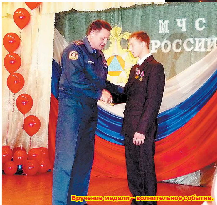
Вручение медали — волнительное событие.

О поступке восьмиклассников из посёлка Ясашная «Новая Эра» уже писала. В марте этого года шестеро ребят, заметив разгорающийся пожар в одном из частных домов, бросились помогать хозяйке выносить вещи из полыхающей постройки, сделали всё, чтобы предотвратить дальнейшее рас-