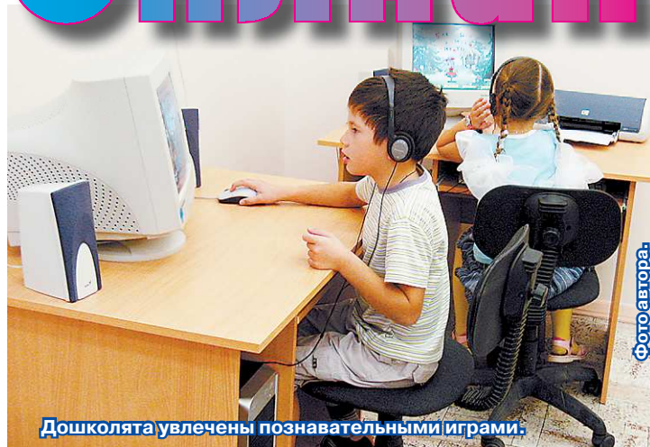
Дошколята увлечены познавательными играми.