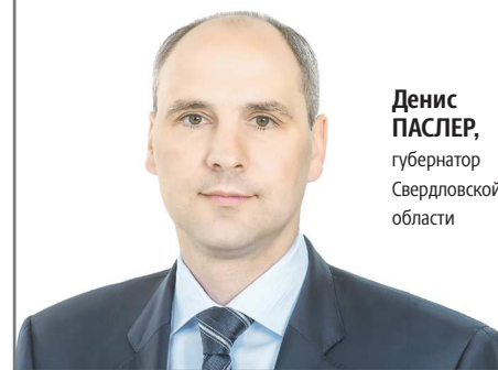
Денис ПАСПЕР, губернатор Свердловской области

“ Свердловская область вновь стала местом встречи неравнодушных и деятельных людей, площадкой для обмена практическим опытом и широкого обсуждения передовых инициатив и проектов, прорывных методик и технологий, которые делают жизнь лучше, справедливее, безопаснее и комфортнее.