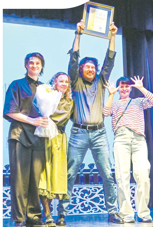
Актерский ансамбль спектакля «Повесть о собаке», Екатеринбургский театр кукол