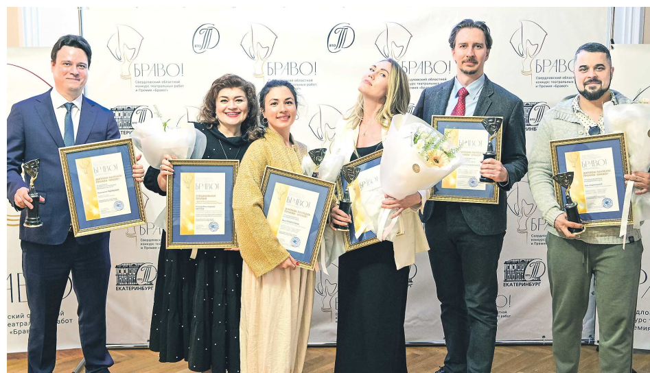
Лауреаты «Браво!» от театра «Урал Опера Балет»