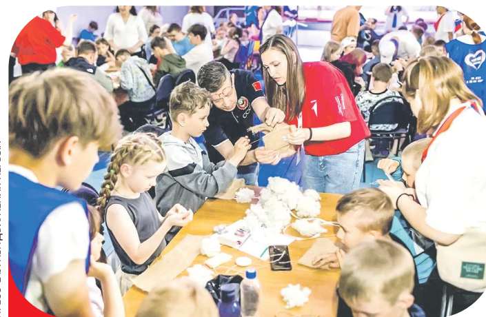
ПРЕСС-СЛУЖБА ДВИЖЕНИЯ ПЕРВЫХ

– Наш проект доказывает, что современный профессионал – металлург, сварщик, слесарь, повар, дизайнер, текстильщик или модельер – это прямой наследник народных мастеров. Нить, связывающая традиционное ремесло и современные технологии, не прерывается, а превращается в надежный канат профессионального успеха. В центре проекта – мастерские, где участники не просто наблюдают, а осваивают ремесла на практике: расписывают матрешки и пряники, работают с гончарным кругом, ткют, знакомятся с валянием и кузнечным делом. Проект важен для школьников, студентов Артинского агропромышленного техникума и потенциальных работодателей территории, – рассказали представители команды Артинского агропромышленного техникума.