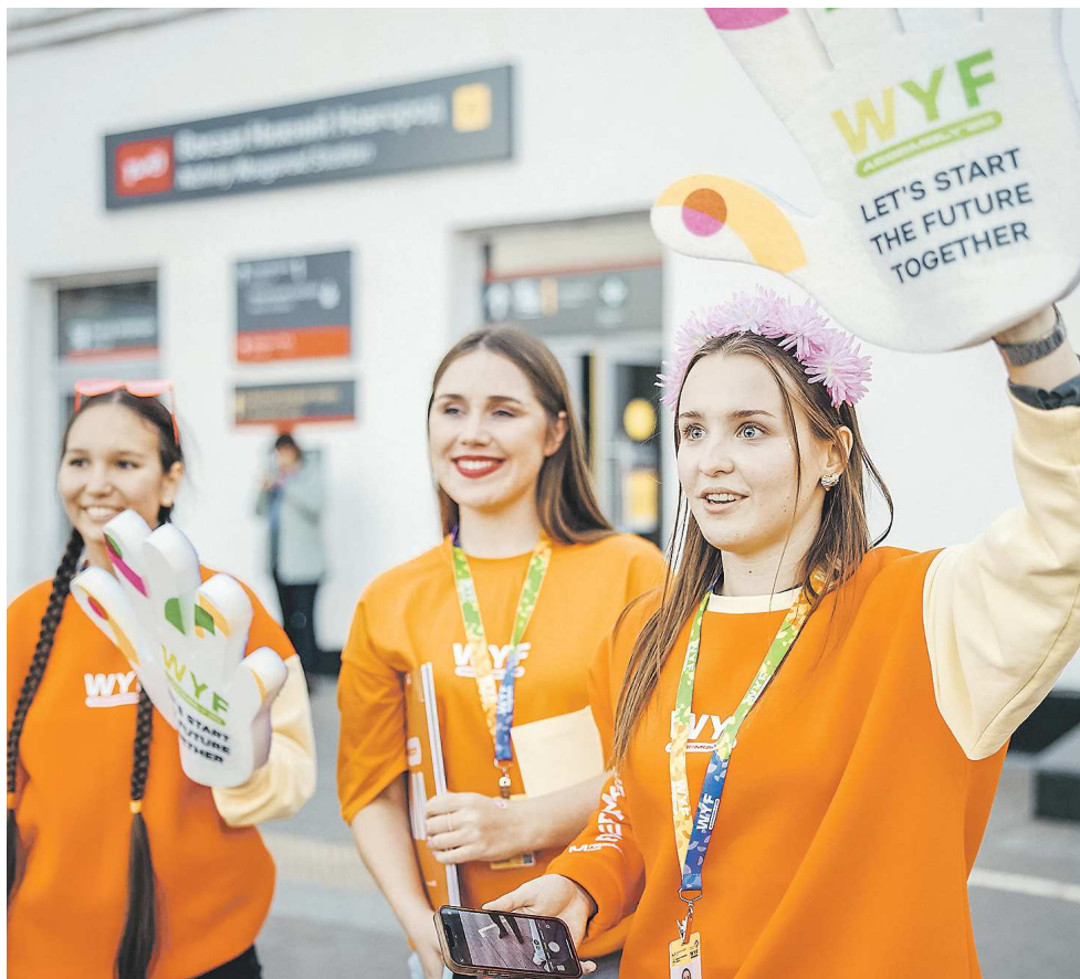
ВСЕМИРНЫЙ ФЕСТИВАЛЬ МОЛОДЕЖИ