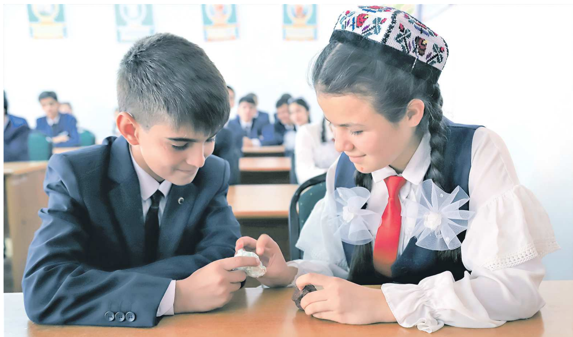
На сегодняшний день проект УГГУ «Юный геолог» реализуется в пяти школах Душанбе