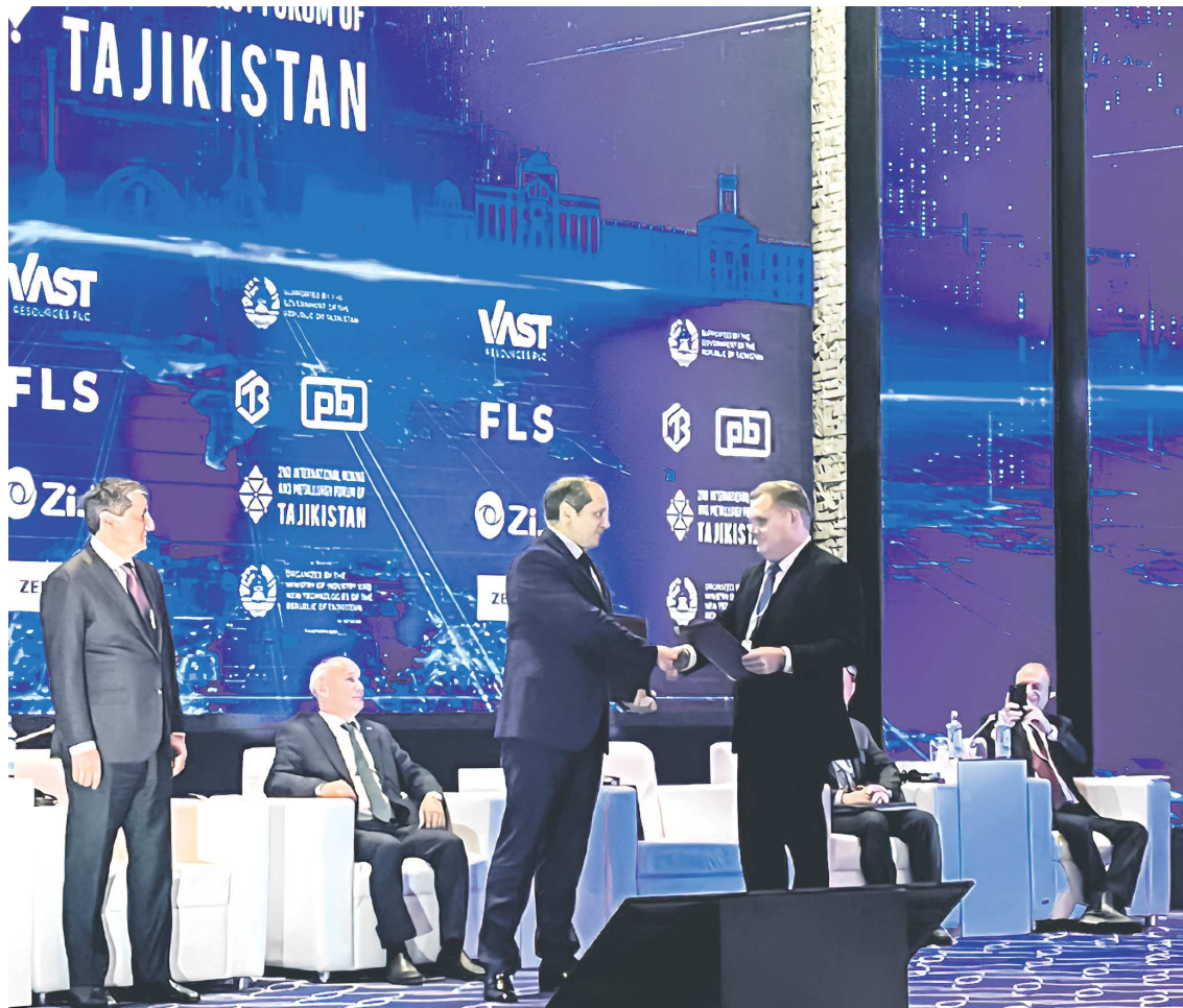
Международный горно-металлургический форум, прошедший в Душанбе, стал площадкой для расширения деловых контактов и укрепления партнерских связей

– В 2004 году было заключено соглашение о торгово-экономическом, научном и культурном сотрудничестве между правительствами региона и Таджикистана. Документ стал основой для нашего взаимовыгодного партнерства, обеспечив системный подход к совместной деятельности. Благо-