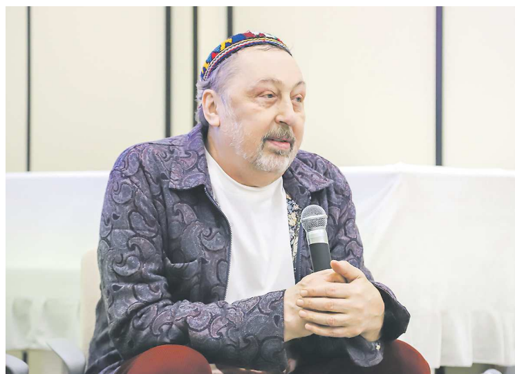
В ходе поездки драматург провел мастер-классы для студентов и преподавателей Таджикского государственного института культуры и искусств

Делегация ЕГТИ была принята в Министерстве культуры Республики Таджикистан, где состоялась встреча с министром