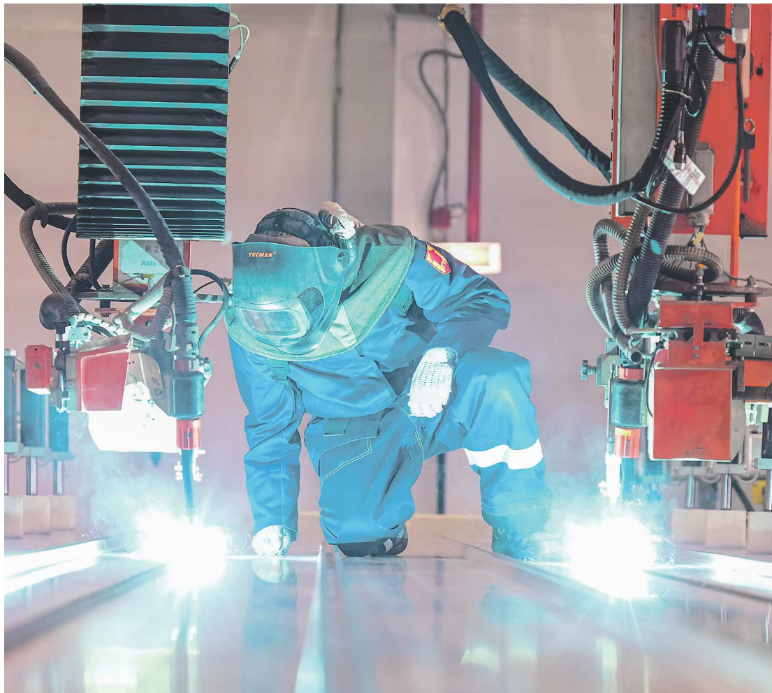
Один из примеров импортозамещения – новые проекты завода «Уральские локомотивы». В 2027 году на предприятии начнут серийное производство первого российского высокоскоростного поезда. На фото – сварка первого кузова будущего поезда