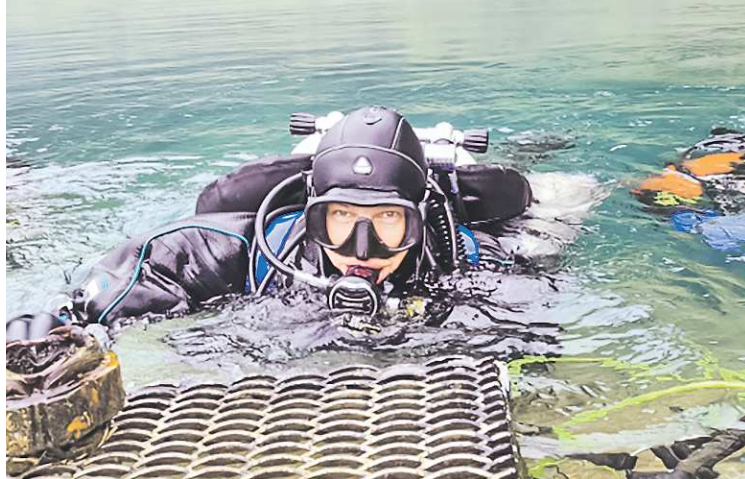
СВЕРДЛОВСКОЕ ОБЛАСТНОЕ ОТДЕЛЕНИЕ РГО

Туристы стремятся увидеть грандиозный Липовский ка-