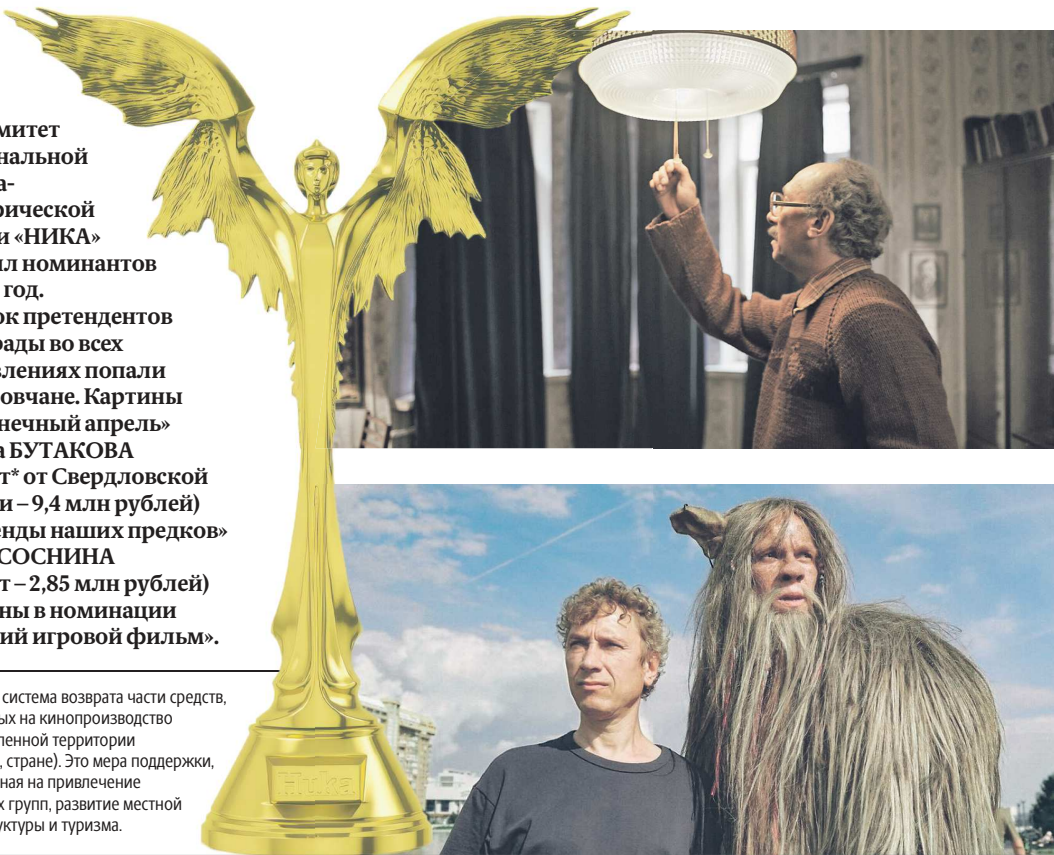
КАДР ИЗ ФИЛЬМА «БЕСКОНЕЧНЫЙ АПРЕЛЬ»

Рибейт* – система возврата части средств, затраченных на кинопроизводство на определенной территории (в регионе, стране). Это мера поддержки, направленная на привлечение съемочных групп, развитие местной инфраструктуры и туризма.