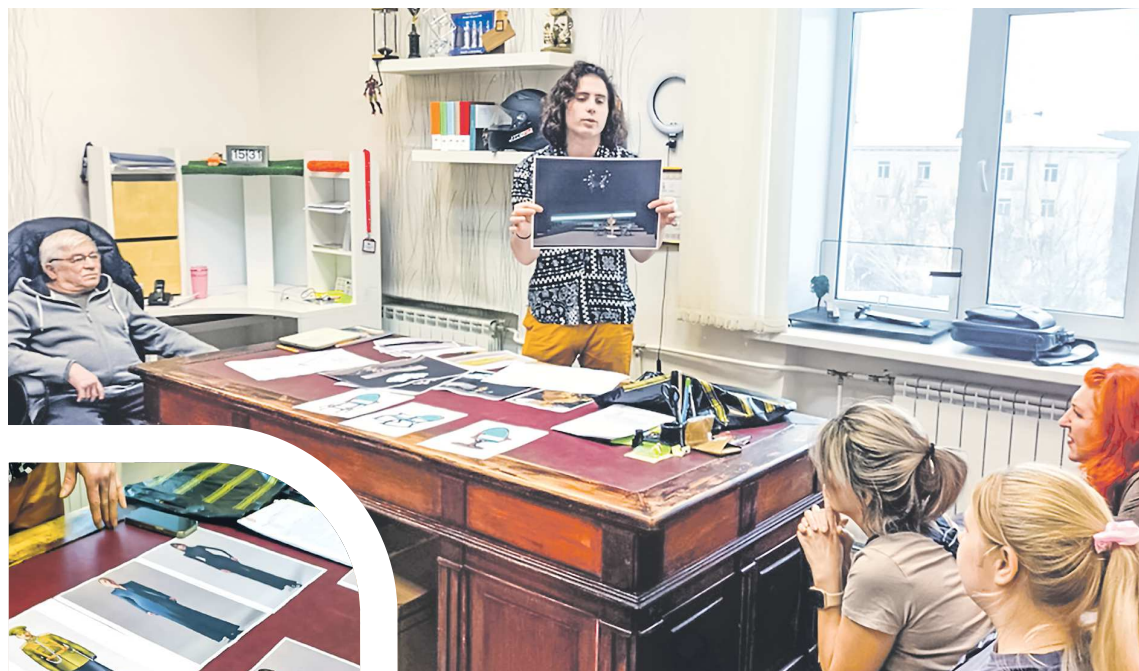
ПРЕДСТАВЛЕНИЕ ТЕАТРОМ «ДРАМА НОМЕР ТРИ»