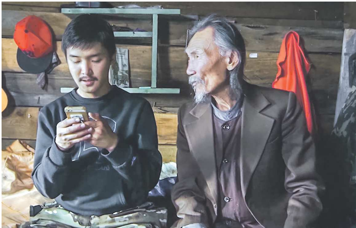
КАДР ИЗ ФИЛЬМА «НАДО МНОГО СОЛНЦЕ НЕ САДИТСЯ», РЕЖИССЕР ЛЮБОВЬ БОРИСОВА