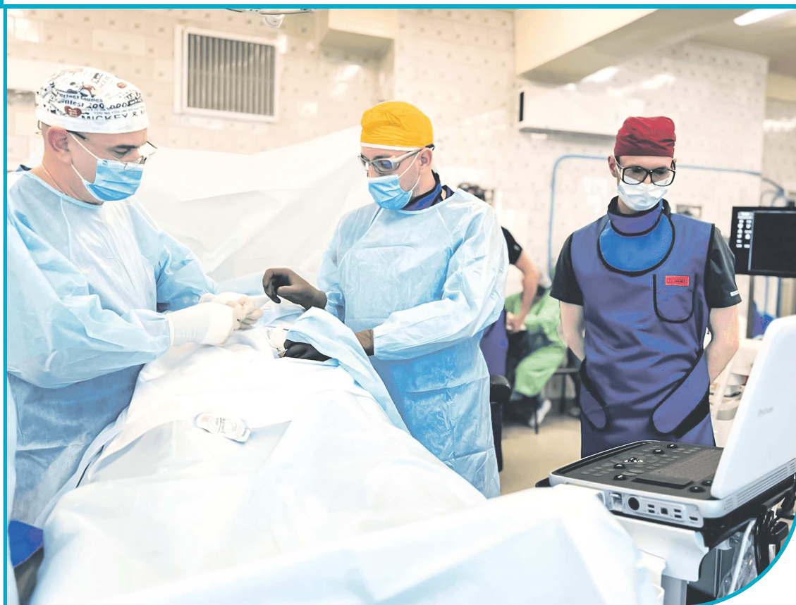
Врачи Свердловского госпиталя для ветеранов войн с помощью жидкого имплантата спасли бойца СВО