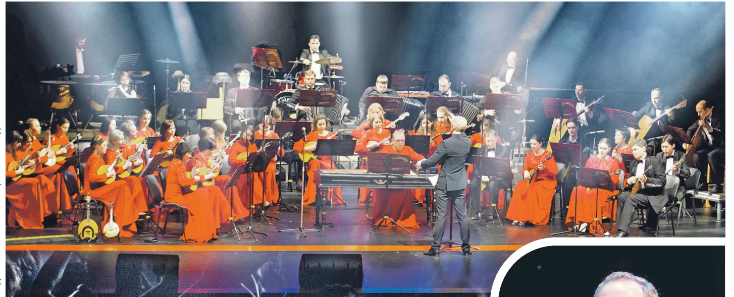
ПРЕДСТАВЛЕНО УРАЛЬСКИМ ЦЕНТРОМ НАРОДНОГО ИСКУССТВА

— Даже — определенное мировоззрение. Мне довелось побывать в одной из