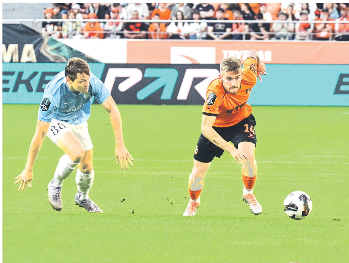
В предыдущем сезоне «Урал» уступил путевку в Премьер-лигу московской «Родине»

«Урал» может начать третий сезон в Первой лиге с тренером, дважды выводившим команды в элиту российского футбола