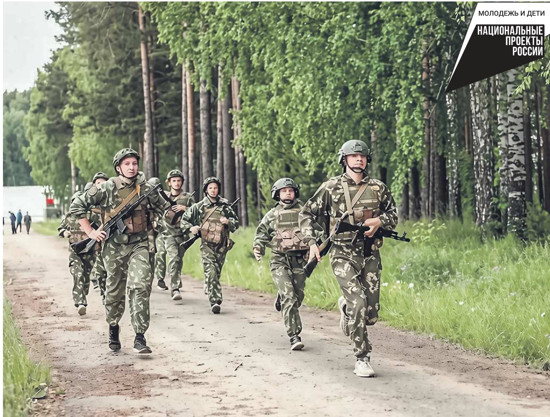
ДВИЖЕНИЕ ПЕРВЫХ СVERДЛОВСКОЙ ОБЛАСТИ

Напомним, «Зарница 2.0» – флагманский проект Движения Первых. До областного финала дошли 24 команды в четырех возрастных категориях. Команда «Беркут Ирбит» неоднократно занимала призовые места в финале игры. Она была сформирована на базе Ирбитского гуманитарного колледжа более шести лет назад. Девиз команды – «Знание. Сила. Верность Отчизне».