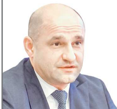
Полномочный представитель Президента России в Уральском федеральном округе Артём ЖОГА

Дорогие ребята! От всей души поздравляю вас с Днем российского студенчества и желаю благополучия, успехов и всего самого доброго! С праздником!