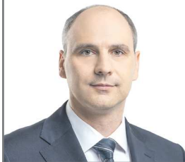
Губернатор Свердловской области Денис ПАСЛЕР