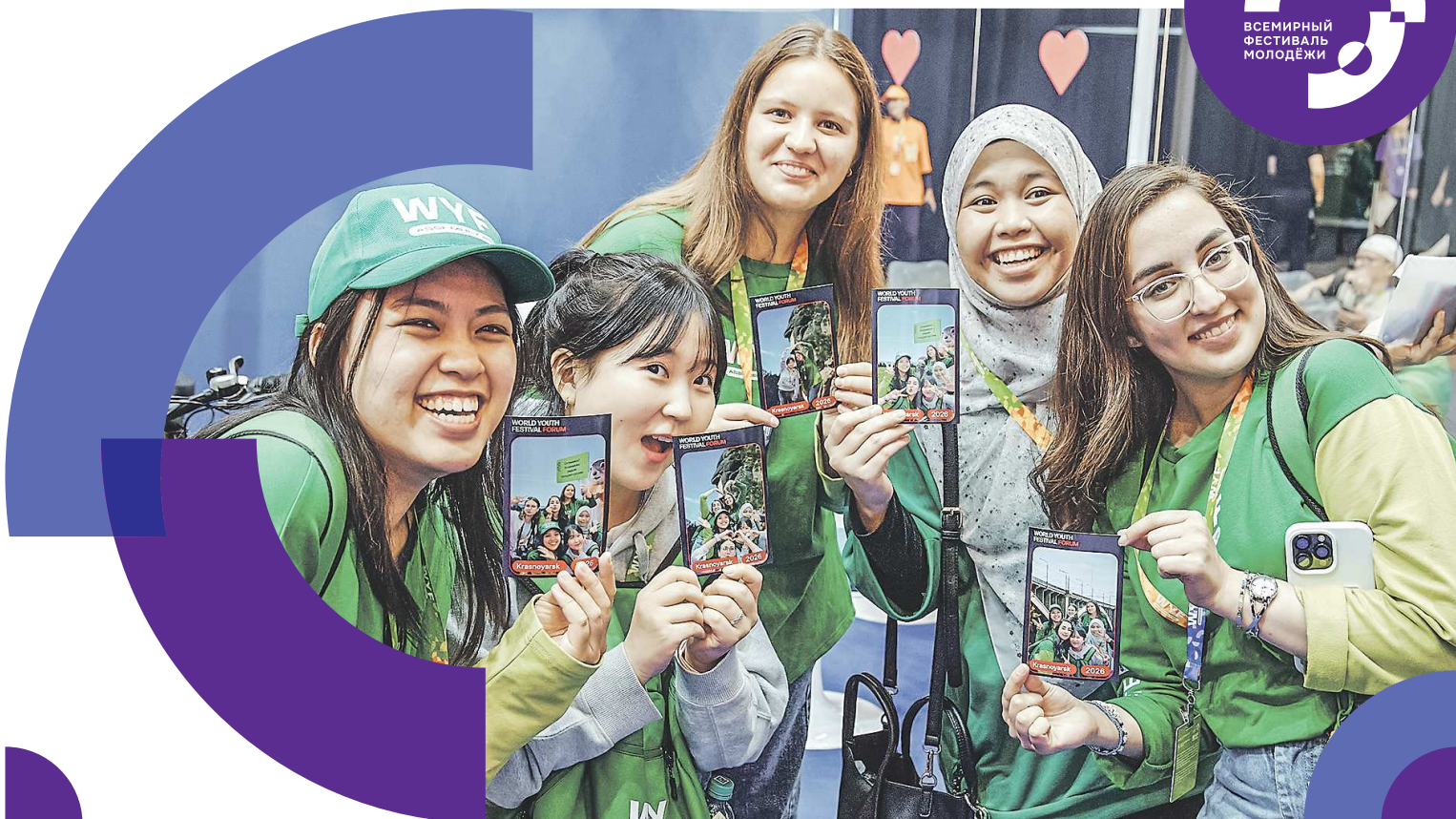
ВСЕМИРНЫЙ ФЕСТИВАЛЬ МОЛОДЕЖИ

Сто дней остается до открытия Международного фестиваля молодежи в Екатеринбурге. Накануне губернатор Свердловской области Денис ПАСЛЕР объявил обратный отсчет до начала главного молодежного международного события 2026 года. Фестиваль пройдет с 11 по 17 сентября. Ожидается, что его гостями станут представители более чем 190 стран.