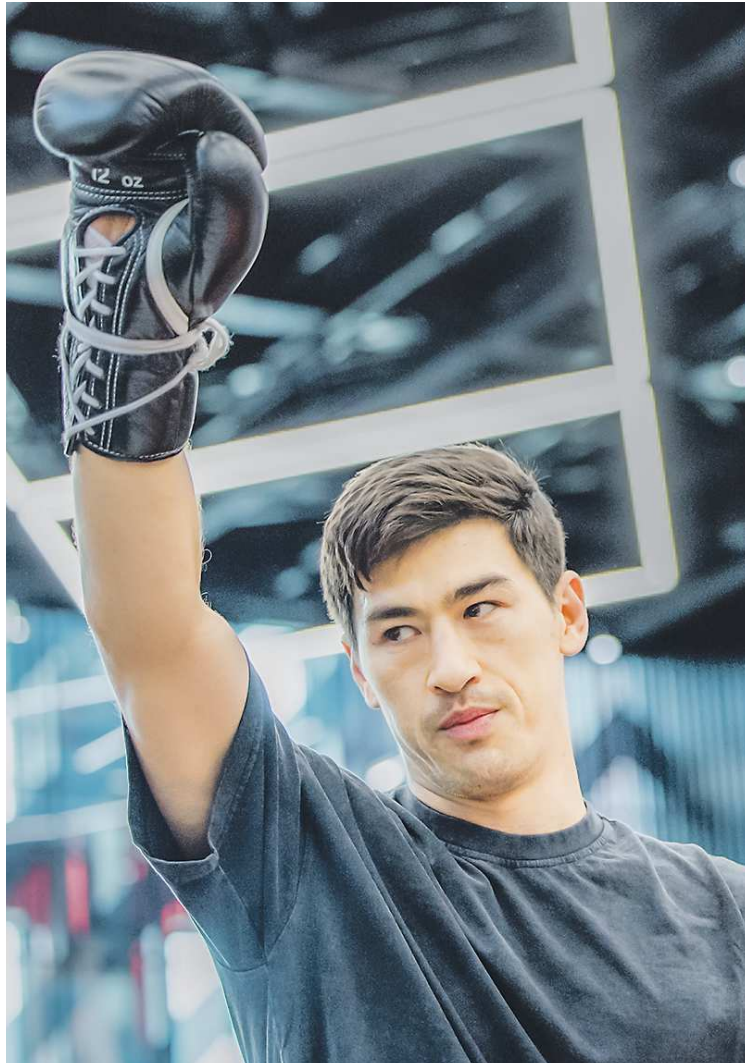
Дмитрий Бивол во время открытой тренировки в Екатеринбурге

Накануне боксеры приехали в столицу Урала, провели открытую тренировку и дали пресс-конференцию.