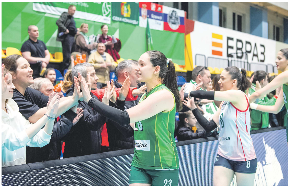
У волейболисток «Уралочки» всегда теплые отношения со своими болельщиками

В 12:00 фестиваль откроет заслуженный тренер России, многократный чемпион страны, шестикратный обладатель Кубка европейских чемпионов Николай Карполь . По-