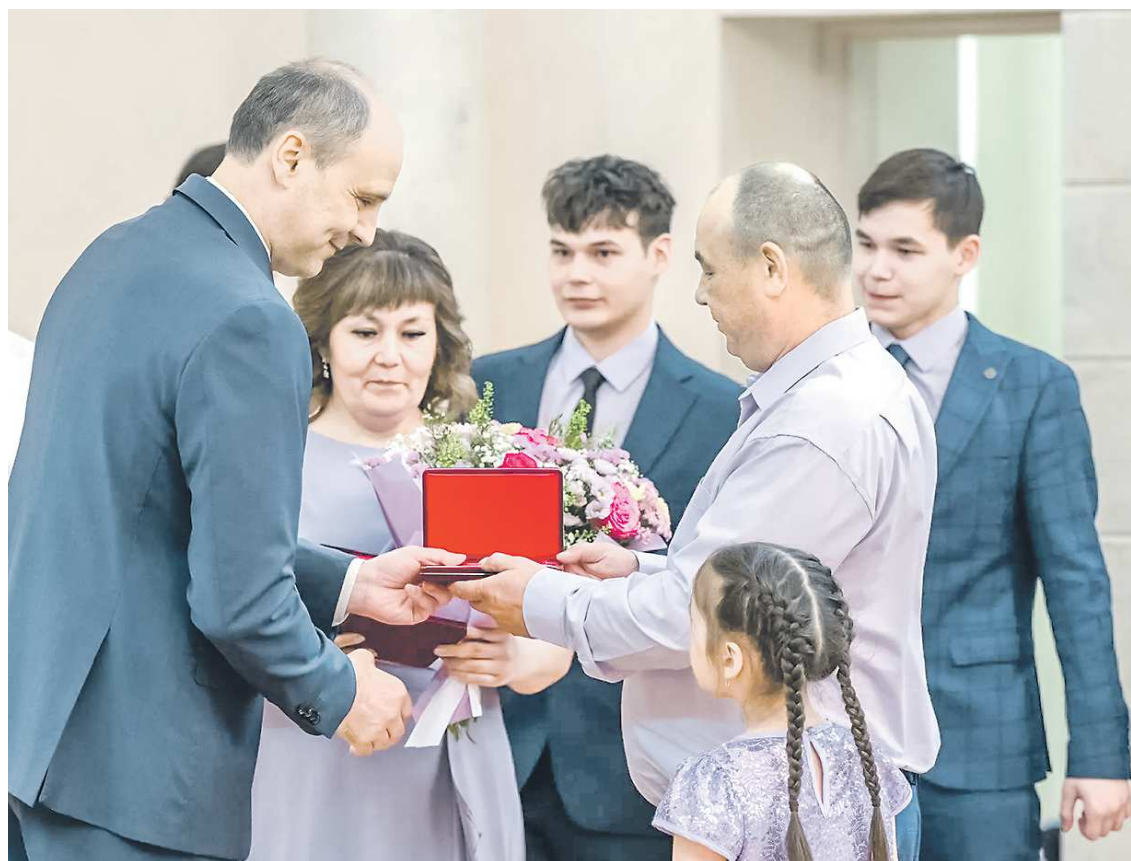
ДЕПАРТАМЕНТ ИНФОРМАТИКИ СВЕРДЛОВСКОЙ ОБЛАСТИ

– Воспитывать 11 детей не просто, но очень интересно. Говорят, будто бы не хватает любви детям в многодетных семьях. Но хватает. Подрастающие так же любят малень-