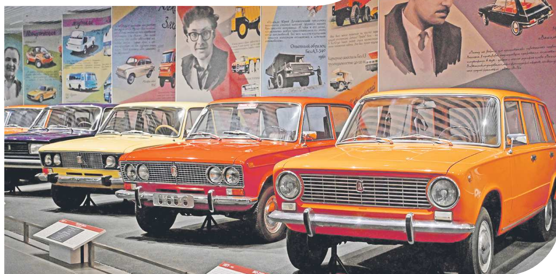
ФОТО: ПОЛИНА ЗИНОВЬЕВА