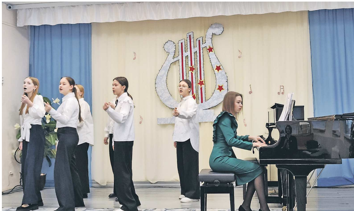
Благодаря реализации проекта инициативного бюджетирования в 2024 году в Байкаловской детской школе искусств появился новый рояль, что позволит расширить возможности ребят в получении дополнительного образования

Еще два проекта касаются сферы дополнительного образования. В рамках проекта