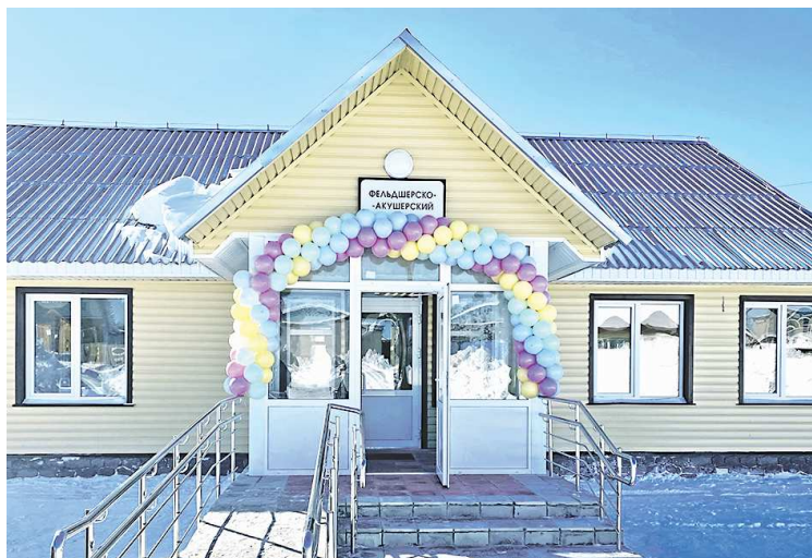
С 2021 года в районе обновили уже восемь фельдшерско-акушерских пунктов, в этом году завершится комплексная работа по модернизации всех модульных сооружений на территории муниципалитета