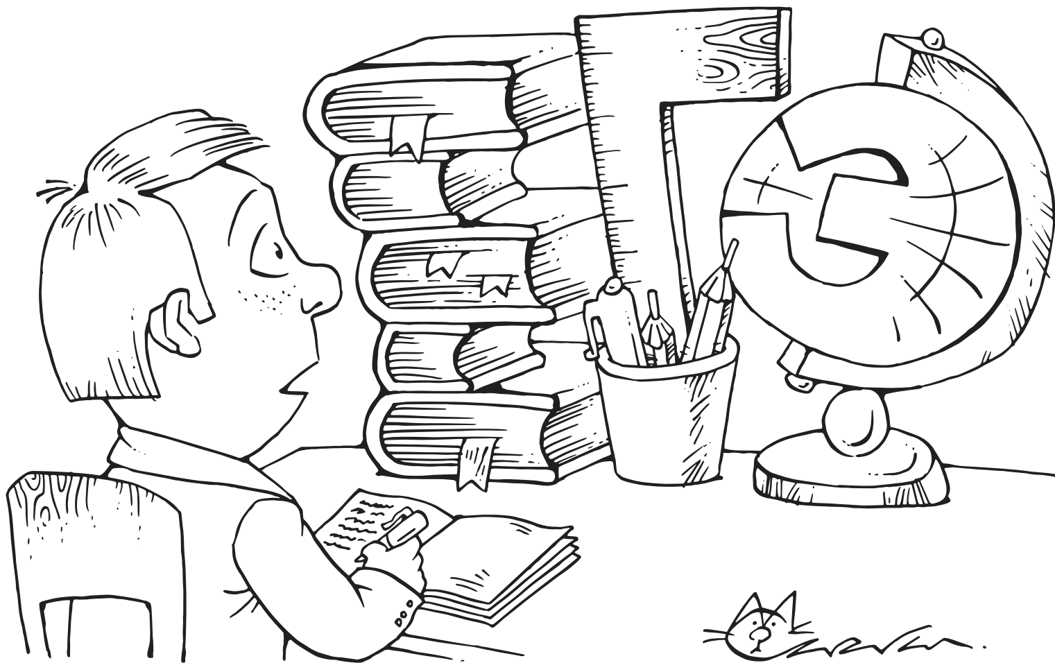
РИСУНОК МАКСИМА СМАГИНА

Большую роль играет и самостоятельная подготовка к экзаменам. Важным и полезным ресурсом при подготовке к экзаменам является открытый банк заданий ЕГЭ на официальном сайте Федерального института педагогических измерений (ФИПИ), в котором размещено большое количество заданий, используемых при составлении вариантов контрольно-измерительных материалов (КИМ) по всем учебным предметам. Для удобства использования задания сгруппированы по тематическим рубрикам.