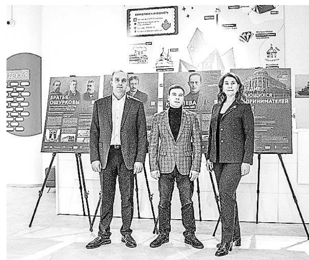
Открытие второй части выставки «Наследие выдающихся предпринимателей России: Урал» в региональной общественной приемной председателя партии «Единая Россия» Д.А. Медведева в Свердловской области (5 февраля, г. Екатеринбург)

Благодарим деловые объединения за совместную работу по разрешению системных затруднений бизнеса!