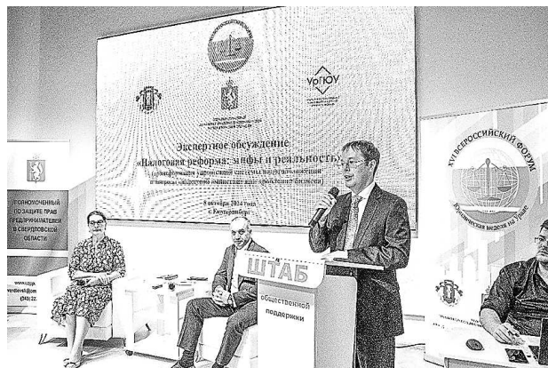
Экспертное обсуждение «Налоговая реформа: мифы и реальность» (8 октября, г. Екатеринбург)