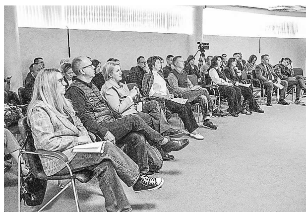
Сессия «Драйверы развития муниципалитетов: инвестиционная привлекательность и роль государственных правозащитников» (9 октября, г. Каменск-Уральский)