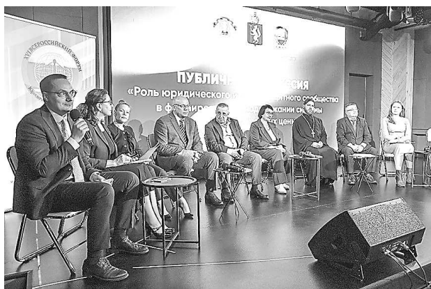
Торжественное открытие и публичная дискуссия XVI Всероссийского форума «Юридическая неделя на Урале» (7 октября, г. Екатеринбург)