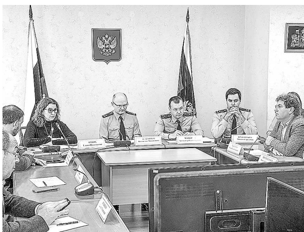
Заседание Общественного совета при прокуратуре Свердловской области по защите малого и среднего бизнеса (30 августа, г. Екатеринбург)