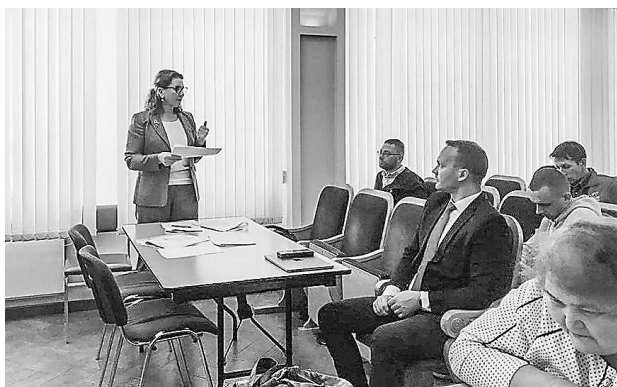
Согласительное совещание Министерства транспорта и дорожного хозяйства Свердловской области по проекту Закона Свердловской области «Об организации транспортного обслуживания населения на территории Свердловской области» (27 сентября, г. Екатеринбург)