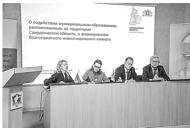
Сессия «Драйверы развития муниципалитетов: инвестиционная привлекательность и роль государственных правозащитников» (9 октября, г. Каменск-Уральский)