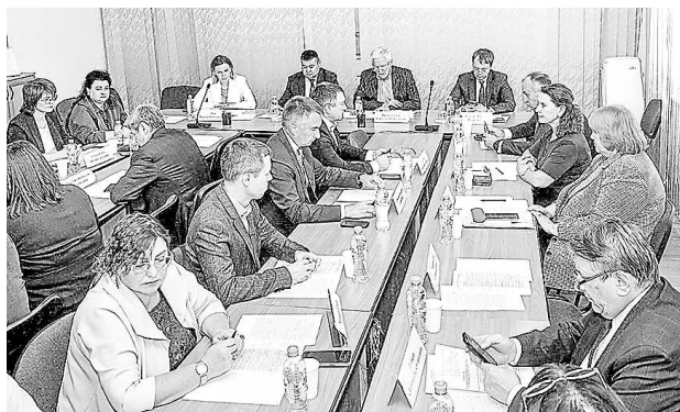
Заседание Общественного совета при УФС России по Свердловской области (30 сентября, г. Екатеринбург)