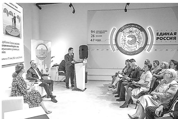
Экспертное обсуждение «Налоговая реформа: мифы и реальность» (8 октября, г. Екатеринбург)