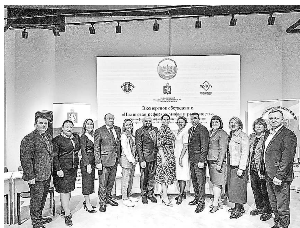
Экспертное обсуждение «Налоговая реформа: мифы и реальность» (8 октября, г. Екатеринбург)