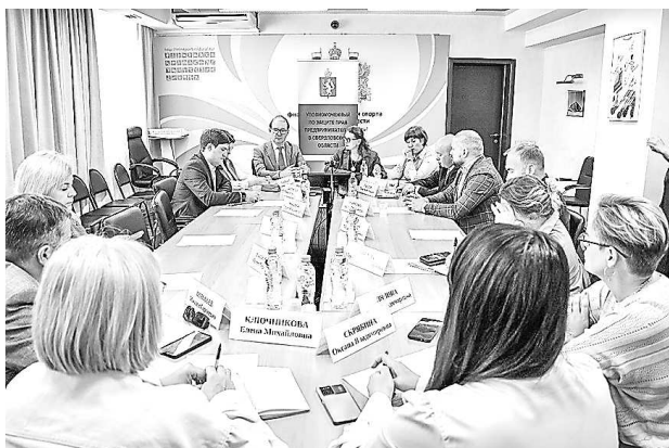
Рабочее совещание о применении единых тарифов на услугу регионального оператора по обращению с твердыми коммунальными отходами, оказываемую ООО «Компания «РИФЕЙ» (10 сентября, г. Екатеринбург)