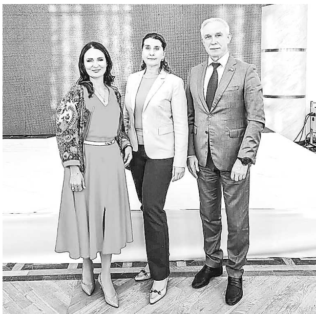
С модераторами секции «Закон о семейном предпринимательстве» – депутатами Государственной Думы Федерального Собрания Российской Федерации С.И. Морозовым и Т.В. Буцкой (23 августа, г. Тюмень)