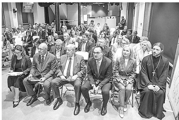
Торжественное открытие и публичная дискуссия XVI Всероссийского форума «Юридическая неделя на Урале» (7 октября, г. Екатеринбург)