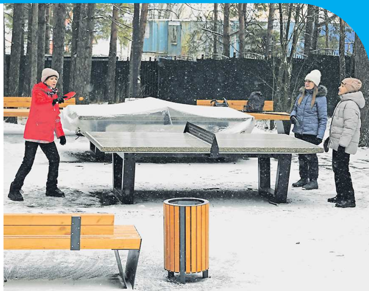
Парк Новой культуры не пустует даже сейчас, до открытия. Активные пенсионеры города с удовольствием проводят здесь досуг

По просьбе жителей в отдаленной части парка оборудовали площадку для дрессировки и выгула собак. В будущем подобные планируется обустроить во всех частях города. Почти все работы в парке уже завершены. Последний штрих – завершение обустройства входной группы. Торжественное открытие запланировано на следующий год.