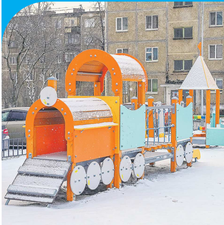
Во дворе микрорайона Хромпик появилась площадка для самых юных жителей

Несколько новых общественных пространств появились в этом году в Первоуральске в рамках программы «Инициативное бюджетирование». Одним из них стала современная многофункциональная спортивная площадка в микрорайоне Пильная.