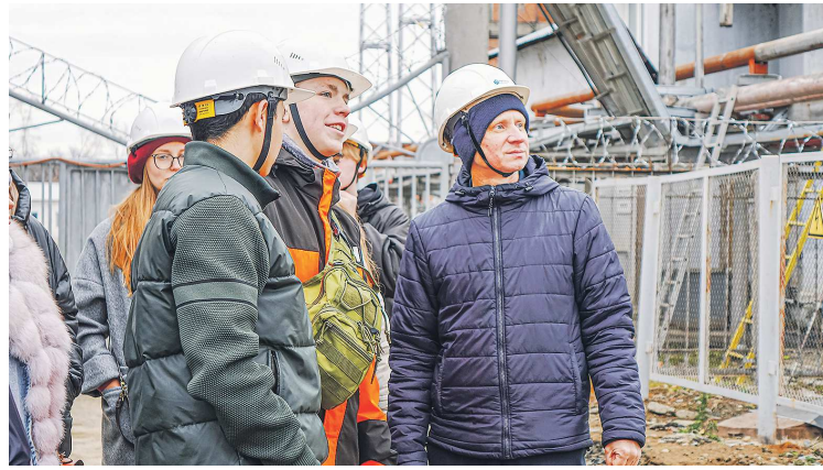
РОССЕТИ / ОПУБЛИКОВАНО НА ПРАВАХ РЕКЛАМЫ

– Возможно, для кого-то из ребят это знакомство станет не