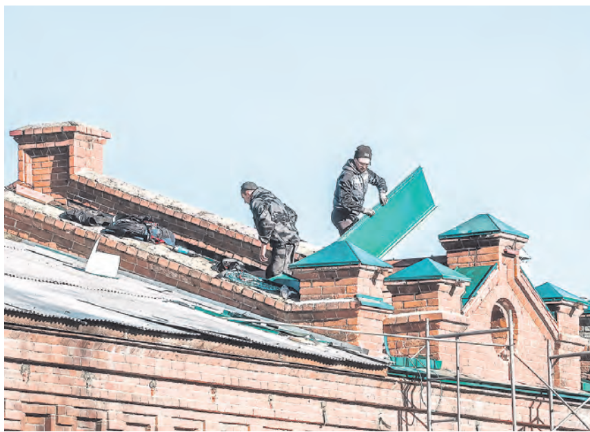
В спиртовом цехе старинного Биохимического завода приступили к обшивке крыши

Привлекают внимание уличные фонари: вдоль набережной вместо классических столбов установлены «дерев-