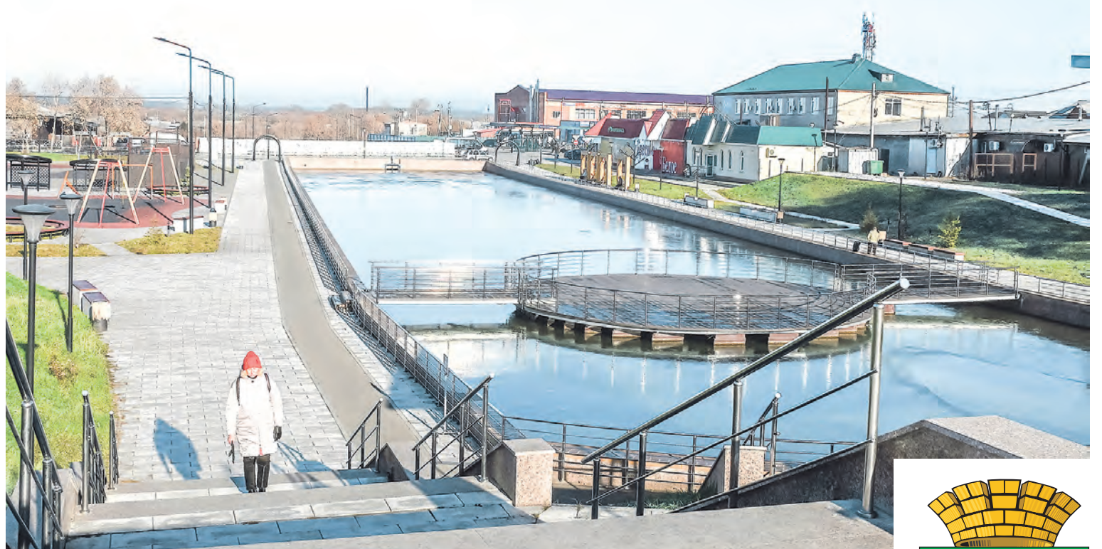
В прошлом году в Талице торжественно открыли после благоустройства второй этап набережной Городского пруда

В 2022 году на верхней части набережной появились пешеходные дорожки и уличное освещение для комфортных прогулок в любое время, уютные скамейки, игровые комплексы для детей и тренажеры для занятий уличной гимнастикой. По утрам здесь можно встретить бодро идущих бабушек, занимающихся скандинавской ходьбой.