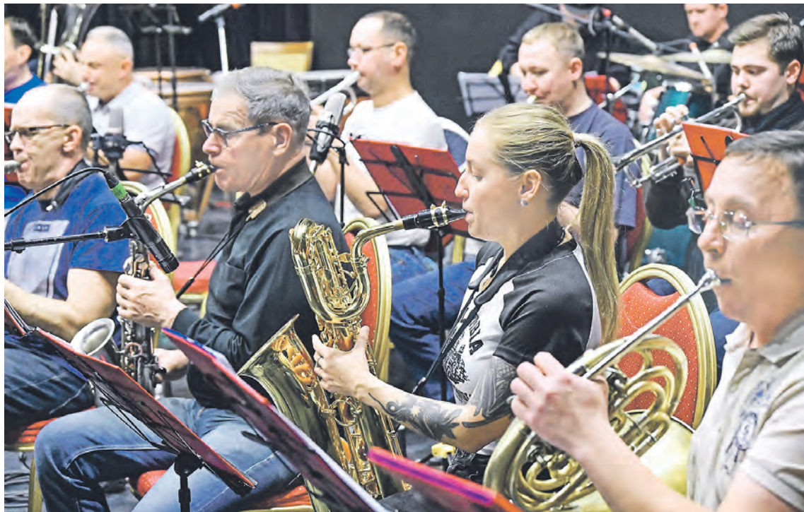
Пока оркестры играют чаще вальсы и марши, но опусы Композиторской лаборатории духовой музыки в Екатеринбурге уже произвели фурор на форуме

Участники форума из Москвы, Санкт-Петербурга, Томской, Самарской, Челябинской, Курганской, Оренбургской, Ярославской, Нижегородской и Белгородской областей, Пермского, Красноярского и Алтайского краев, Ханты-Мансийского автономного округа и Республики Башкортостан обсуждали две глобальные темы – «Состояние и проблемы обучения на духовых инструментах» и «Новый репертуар для духовых оркестров – дух современности или веление времени». В рамках заявленных тем речь шла о духовой музыке в контексте культурного кода Алапаевской земли, о роли Интернета, соцсетей и искусственного интеллекта для популяризации духового искусства. На примере практик Сахалина и Урала шел обмен опытом: как вдохновить детей играть в духовом оркестре. В разговоре о репертуаре наибольший интерес специалистов вызвала инициатива Композиторской лаборатории духовой музыки в Екатеринбурге. Впро-