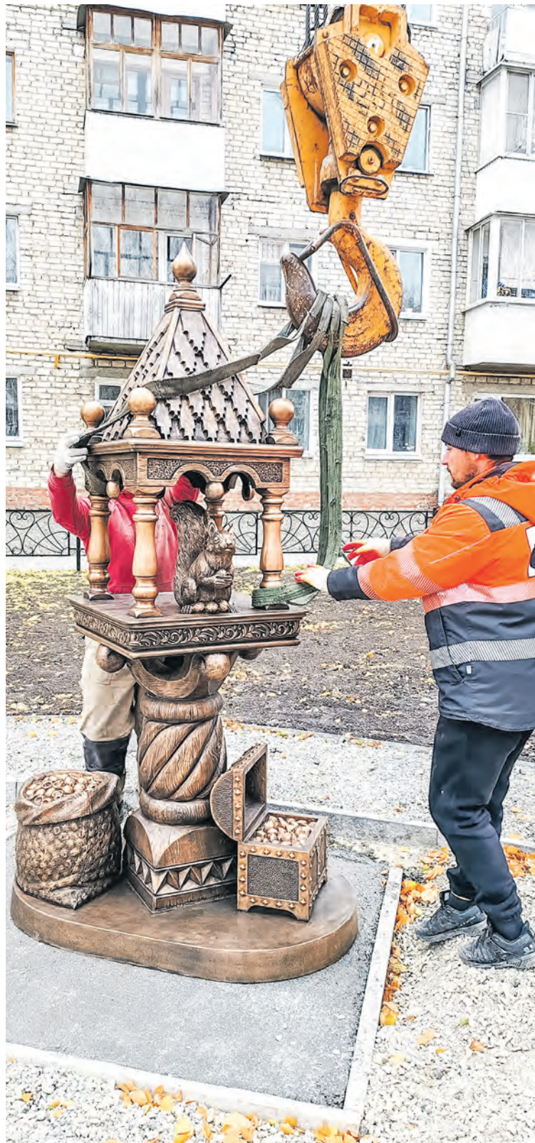
В новом сквере на Серебрянке уже появились первые обитатели – герои сказок Александра Пушкина