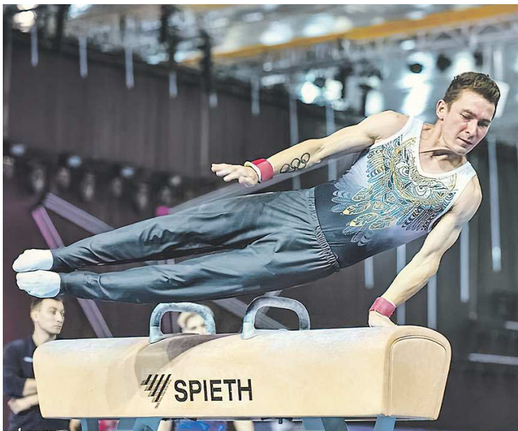
Давид Белявский во время выступления на коронном снаряде

Победитель и призер Олимпийских игр, победитель и призер чемпионатов мира и Европы, многократный чемпион страны – регалии Давида Белявского можно перечислять долго. Но он продолжает выступать и навязывать конкуренцию новым звездам отечественной спортивной гимнастики. На чемпионате страны Давид квалифицировался в финалы в двух своих коронных видах программы – на коне и на параллельных брусьях. На коне Белявский выдал почти идеальное выступление, по-