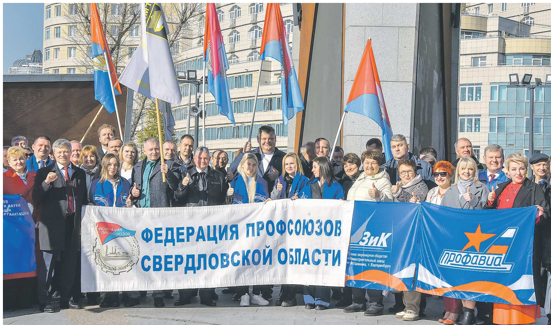
После собрания активисты провели акцию «Профсоюзы – за достойный труд!» у стелы «Город трудовой доблести»

– Безработица у нас на историческом минимуме, это здорово. Однако мы видим, что сложилась необычная ситуация,