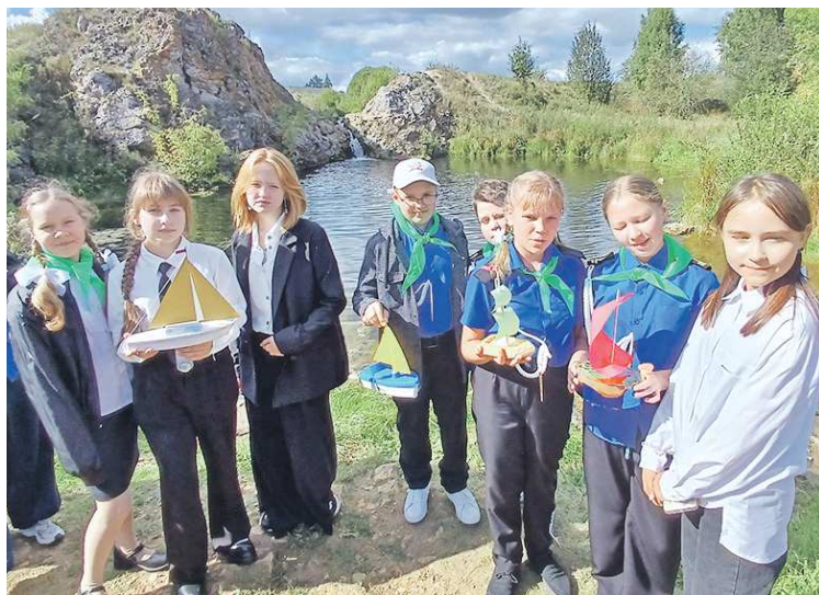
Юнкоры со своими корабликами