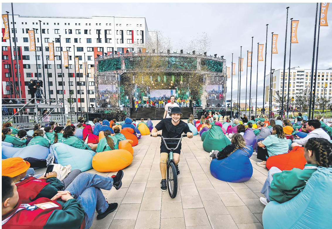
«Утро» – единственный форум в России, который каждый год меняет регион проведения. В прошлом году он проходил в Свердловской области на базе кампуса УрФУ