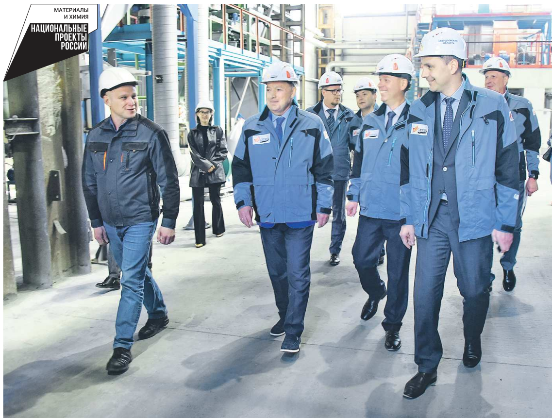
Глава региона Денис Паслер посетил ведущие цеха единственного в России завода по производству динасовых огнеупоров им. Е.М. Гришпуна в Первоуральске (АО «Динур»). Его продукция востребована на всех металлургических предприятиях страны

Завод является градообразующим предприятием Первоуральска и одним из старейших не только в Свердловской области, но и в России. Сегодня он входит в группу компаний «Полипласт». Это крупнейший в стране холдинг по выпуску наукоемких химических продуктов для различных отраслей